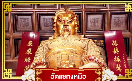
วัดเขกทมิว